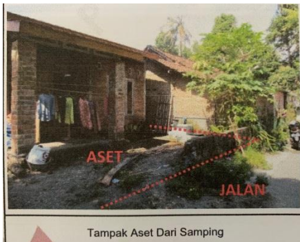
Tampak Aset Dari Samping