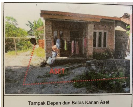
Tampak Depan dan Batas Kanan Aset